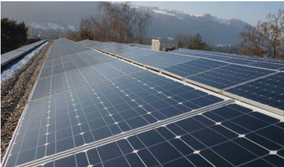
Photovoltaik-Zellen wandeln die Strahlen der Sonne direkt in Strom um.

Seit September 2005 ist auf dem Dach der Schulanlage Schlossmatt in Münsingen ein Photovoltaik-Kraftwerk in Betrieb. Grundidee für dieses zukunftsweisende Projekt war, die Kraft der Sonne dort zu nutzen, wo es ökonomisch und ökologisch sinnvoll ist. Gleichzeitig leisten wir mit der Anlage einen Beitrag zum Schutz unserer beschränkt vorhandenen Energie-Ressourcen. Die Gemeinde Münsingen hat sich mit einem Betrag von 100'000 Franken an den Gesamtkosten des Bauwerkes von rund 190'000 Franken beteiligt. Die Stromproduktion beläuft sich auf ca. 19'000